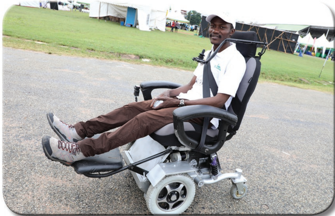
Mmoja wa wabunifu akiwa na kiti maalum cha walemavu alichokibuni wakati wa kilele cha Mashindano ya Kitaifa ya Sayansi, Teknolojia na Ubunifu (MAKISATU) 2020