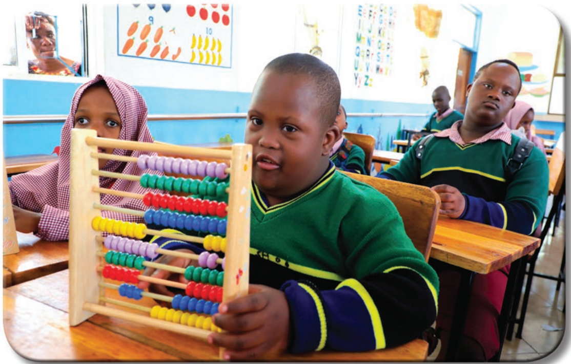
Baadhi ya wanafunzi wa Shule ya Msingi Buhongwa ya Mkoani Mwanza wakitumia vifaa maalum vya kuhesabia kwa ajili ya watoto wenye mahitaji maalum