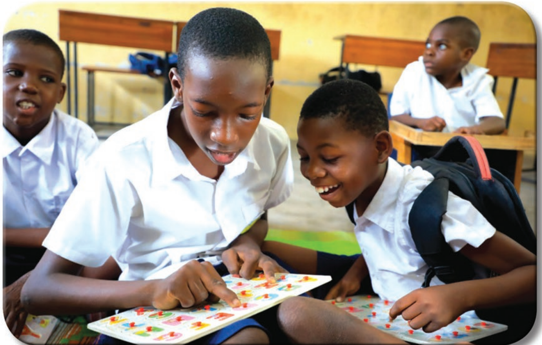
Wanafunzi wenye mahitaji maalum wakitumia vifaa vilivyounuliwa na Serikali kwa lengo la kuimarisha ufundishaji na ujifunzaji