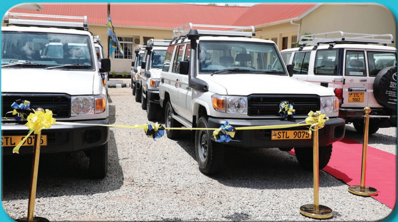
Ugawaji wa magari 37 ya Uthibiti Ubora wa shule kwa ajili ya kusogeza huduma katika Halmashauri