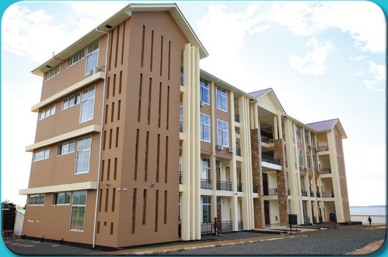
Jengo jipya la Madarasa lililojengwa na Serikali katika Chuo Kikuu Mzumbe kilichopo Mkoani Morogoro kwa ajili ya kuimarisha ufundishaji